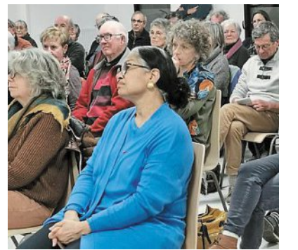
Zakiyatou Oualet Halatin, ancienne ministre du Mali, lors de la conférence-débat, à Tréméloir.

Zakiyatou Oualet Halatin, ancienne ministre du Mali, a introduit la soirée en expliquant l'importance d'une vision historique, pour comprendre les multiples facettes des populations vivant dans la zone du Sahara-Sahel : « Un immense brassage, depuis des siècles, des cultures, des langues, des religions avant et après l'expansion de l'islam. Les colonisateurs ont produit, par la suite, des frontières artificielles qui ont éclaté plutôt que rassemblé les différentes ethnies. Les puissances extérieures comme les différents clans militaires ravivent les replis identitaires pour mieux asseoir leur pouvoir », explique-t-elle. Ensuite, Ibrahim Ag Youssouf, linguiste malien, s'est foca-