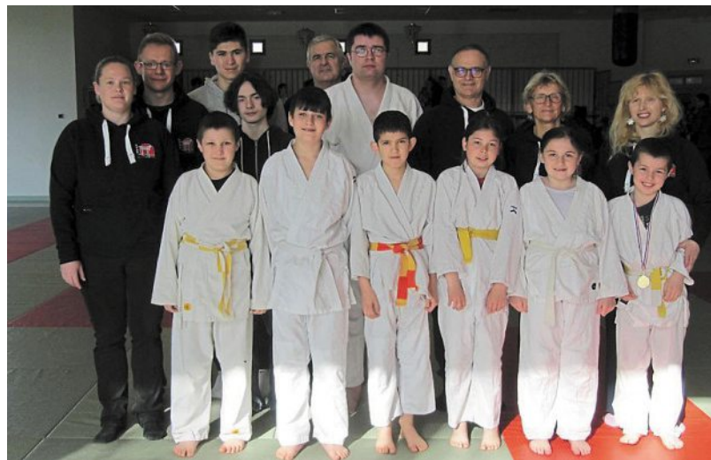
Une vingtaine de licenciés de l'École plérinaise d'arts martiaux ont participé au tournoi de samedi.

Une soixantaine d'enfants au tournoi interclubs de judo