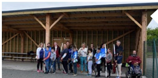
Préau des archers , le pas de tir des archers est à présent abrité par un préau sur le plateau sportif Bruno Auffray.