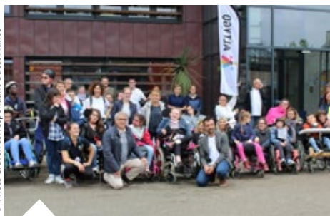
Centenaire Altygo , cette année, ALTYGO fête ses 100 ans, à cette occasion de nombreux défis seront proposés. Parmi ces défis, la course relais est passée par pordic le mercredi 19 juin.