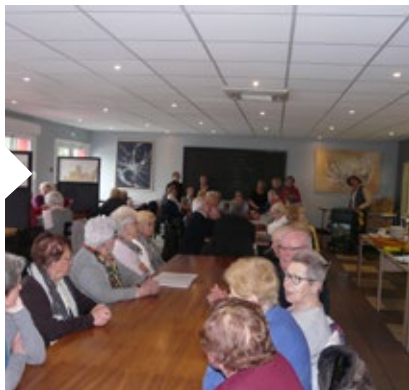
Goûter des seniors , Le goûter offert par le CCAS a eu lieu le mercredi 12 juin à l'Express, au son d'un orgue de Barbarie.