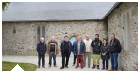
Chapelle du Vaudic , Fin des travaux de pavage et d'aménagement paysager.