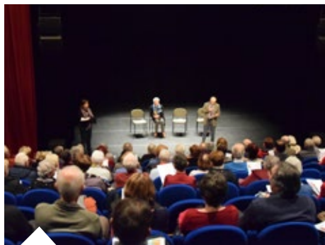
Spectacle Juliette au pays des embuches , sur la prévention des chutes des personnes âgées, vendredi 23 novembre au Centre culturel de la Ville Robert.