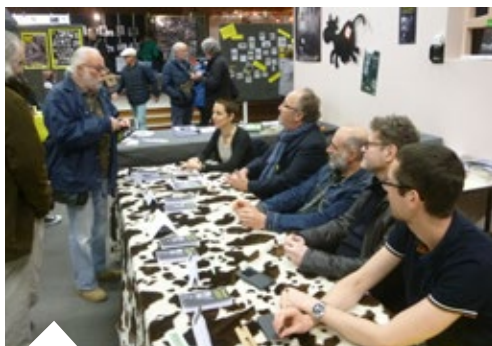
Salon Noir sur la ville , 17 et 18 novembre à Lamballe, dédicaces du recueil La Noiraude par les lauréats du concours 2018.