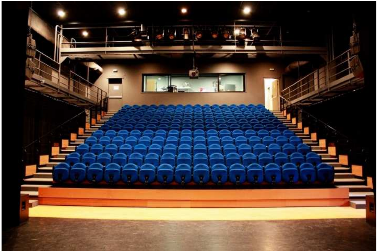
La Loge :