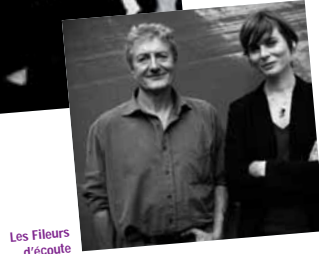
Les Fileurs d'écoute