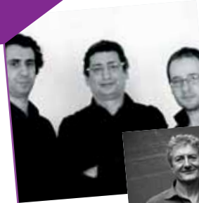
Le Trio Invite

Habitué à mélanger les genres artistiques autour de la projection d'un film - musique, conte, lecture, danse, ateliers divers de manipulation et découverte du langage cinématographique -, le collectif cinéma 22 propose, tout au long de l'événement Jazz Nomade en Côtes d'Armor, des films, de la musique, de la lecture, de la danse et des bulles en différents lieux du territoire costarmoricain. Le collectif cinéma 22, réseau de lieux et de structures travaillant autour de la diffusion culturelle cinématographique et de l'éducation à l'image propose, depuis 2007, diverses actions et animations culturelles autour du cinéma.